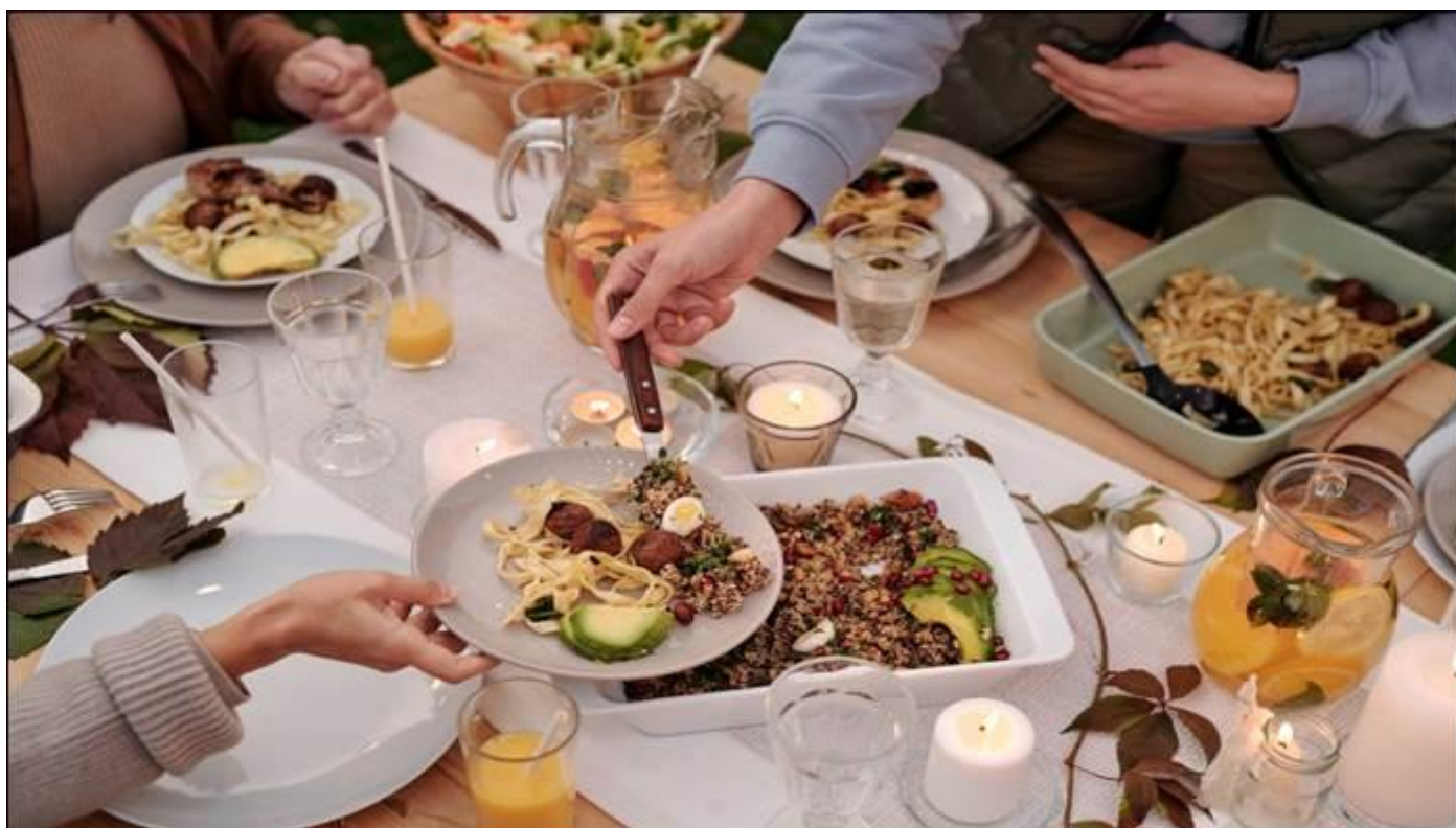
TABLE D'HÔTES / MITTAGSTISCHE